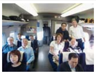
⑯ Traveling by Shinkansen bullet train 新幹線での移動