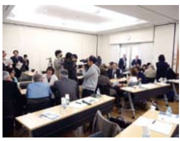
④Visit to Kani Multicultural Centre FREVIA 可見市多文化共生センター「フレビア」訪問